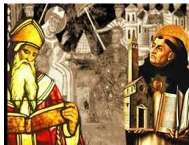
Figura 2: Filosofia medieval Cristã A Patrística e a Escolástica

Destaca-se entre as referências desta escola de pensamento Santo Agostinho, um dos mais influentes dos pensadores cristãos. Buscou a solução do conflito entre a fé cristã e a cultura clássica, escrevendo a obra pedagógica denominada De Magistro . Já a Escolástica, possuía como representante Santo Tomás de Aquino. Sua principal obra foi a Suma Teológica . A Escolástica buscava elementos racionais que explicassem os princípios da fé cristã. A organização educacional cristã estava estruturada através do Trivium (Gramática, Dialética e Retórica) e o Quadrivium (Aritmética, Geometria, Música e Astronomia).